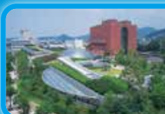
長崎原爆資料館の 見学