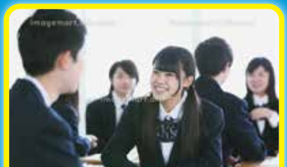
長崎 SDGs 平和ワークショップ